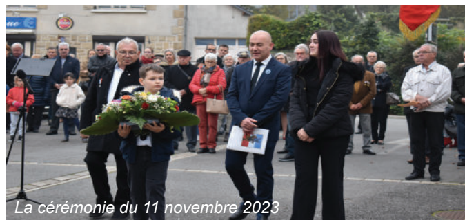
La cérémonie du 11 novembre 2023