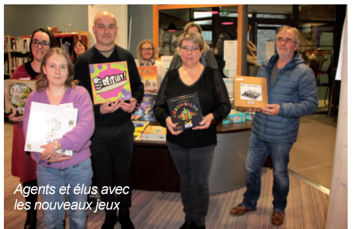
Agents et élus avec les nouveaux jeux