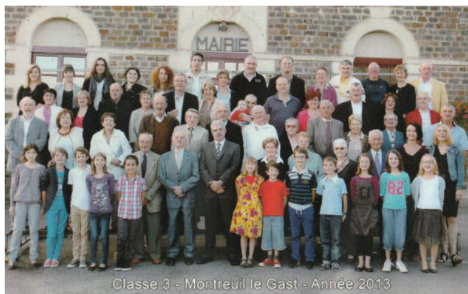
Classe 3 - Montreuil le Gast - Année 2013

Avec la participation du Département d'Ille-et-Vilaine / Médiathèque départementale, la médiathèque accueille en septembre - octobre, l'exposition "Girlz - le rap au féminin". Horaires en dernière page