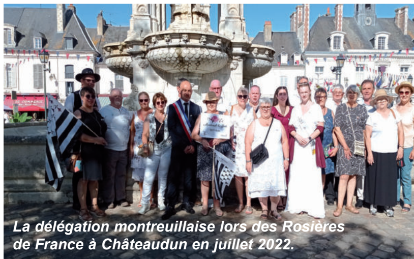
La délégation montreuillaise lors des Rosières de France à Châteaudun en juillet 2022.

En ma qualité de nouveau Président de l'Association, j'ai le plaisir de vous informer que, cette année, le rassemblement des Villes Rosières de France aura lieu à Fleury-la-Rivière, le week-end du 15 Août.