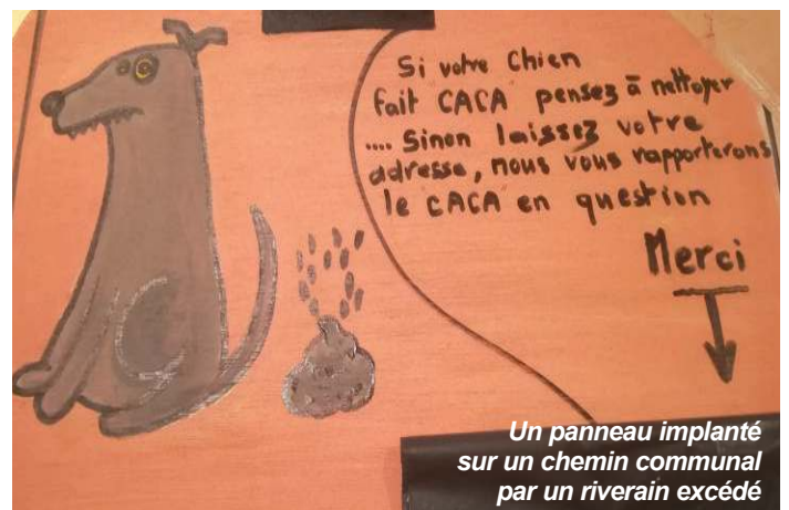
Un panneau implanté sur un chemin communal par un riverain excédé

Vous aimez sortir votre chien pour lui permettre de courir et se défouler ? C'est également l'occasion idéale pour faire ses besoins, oui mais quand il fait ses besoins, il faut penser à les ramasser. Ne sortez donc jamais sans votre sac ramasse crotte !